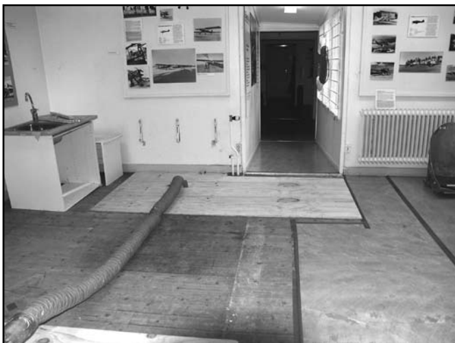
Det vattenskadade utrymmet under "torkperioden" där även det nya pentryt fick tömmas och golvet brytas upp.

Ett högst önskat problem drabbade i slutet av oktober museet i form av en vattenskada. Nu kan vi dock meddela att allt, efter ganska många om och men, är lagat och återställt. Det var ett av de ursprungliga gamla elementen som sprungit läck och hunnit släppa ut en hel del vatten på golvet i mellanrummet i museet innan skadan upptäcktes. Museet är ju ofta obemannat under flera dagar. Dessutom upptäcktes skadan i slutet av oktober, strax innan det var dags för "Spitfiredagen", som gjorde att utställningen fick lov att återställas temporärt i samband med öppethållningen, trots att golvet var upprivet och torkutrustningen gick för fullt. Utöver en massa extra arbete för personalen kostade det hela naturligtvis ganska mycket pengar även om försäkringen täckte det mesta. Nu är dock allt lika fint som innan skadan.