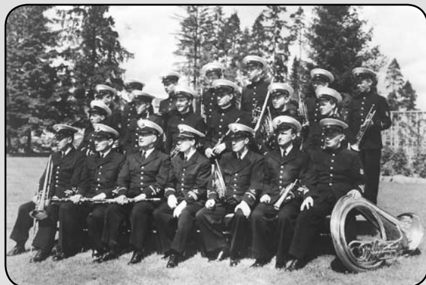
F11 musikkår uppställd för fotografering 1944.

Den dagliga verksamheten på Skavsta bestod i undervisning av musikkårens personal. Förutom den rent militärt betonade musiken skulle även andra musikformer kunna spelas. När det gällde konsertverksamheten dominerade framträdanden på flottiljen och man spelade vid luncher och middagar, i flottiljverkstaden, vid forum, på olika mässar osv. Fortfarande minns också många Nyköpingsbor med glädje när F 11 Musikkår marscherade genom Nyköpings gator. Kåren spelade även dansmusik i olika sammanhang, som t.ex. sommartid under F 11:s tidigare år på dess egna dansbana ett par gånger i månaden. Kårens spelningar av mera civilt slag skedde i parker, på sjukhus, Hålllets friluftsservering,