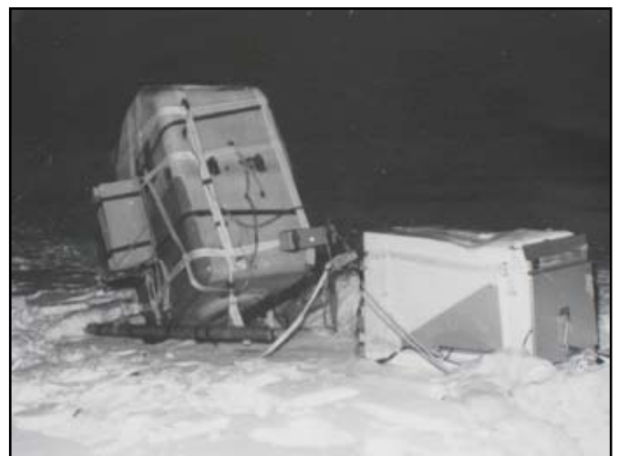
Det hemligstämplade fyndet på Yngaren den 20 januari 1956.

Den första spaningsballongen, (med kameror), hittades på sjön Yngaren, 20 km NV Nyköping den 20/1 1956, varför denna epok i kalla kriget även har en direkt anknytning till F 11 och Nyköping. Vindriktningen var sådan att om ballongen hade fortsatt på kurs i ytterligare 15 km, hade den hamnat på Skavsta, dåvarande flygflottiljen F 11!!