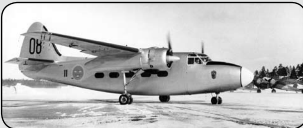
Tp 83 Pembroke fotograferad på 5 div platta en vinterdag någon gång under vintern 1958/1959. Pembroken kom till F 11 1958 och S 18 i bakgrunden flög sista gången i maj 1959.

I juli 1954 offentliggjordes att Kgl. Flygförvaltningen (KFF) hade köpt in 16 st engelska Pembroke C Mk 52, kallade Tp 83. 1963/64 inköptes ytterligare 2 st Pembroke-plan. Tp 83 kom att bli ett mångsidigt flygplan, som vid sidan av rena transportflygningar även brukades för ambulans-, VIP-, forskningsflygningar