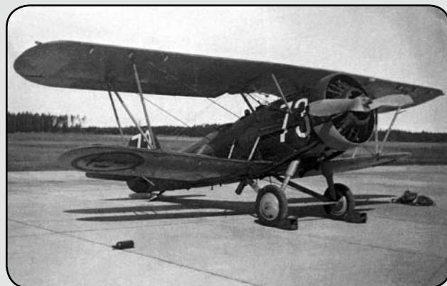
S 9L nr 401 (F 11 - 73) på 1. div platta på F 11 1943/44.

Under åren 1943 - 1947 var F 11 tilldelad en S 9/Hawker Osprey som målbogseringsflygplan. Typen var utvecklad ur den mer kända Hawker Hart och planet hade gjort tjänst på flygplankryssaren Gotland åren 1935 - 1942. Det var ett tvåsitsigt biplan med stafflade och fällbara vingar och kunde vara utrustat med flottörer (S 9) eller hjullandningsställ (S 9L). S 9:an startades från flygplankryssaren med katapult och användes huvudsakligen för spanings- och eldledningsuppdrag. År 1942 överfördes S 9-planen till F 2/Hägernäs. Men tiden på F 2 blev kortvarig då flottiljen var i färd med att ombeväpnas till Saab S 17 BS.