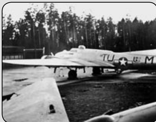
B17G/"Flygande Fästning" kallad BOBBIE ANNE parkerad på F11 i oktober 1944

Som exempel landade den 7 oktober 1944, kl 1618 ett amerikanskt bombflygplan av typen B17G/"Flygande Fästning" kallad BOBBIE ANNE på Skavstafältet. Detta plan hade deltagit i en attack mot viktiga oljean-